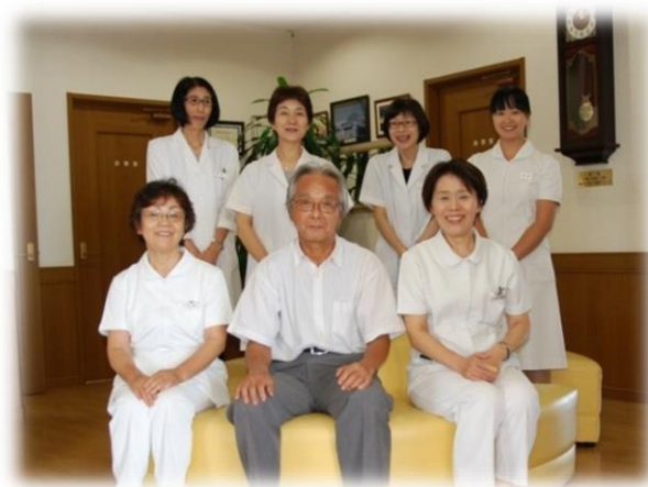
岩田先生とスタッフのみなさん