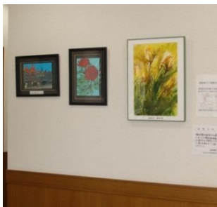
絵画や手芸品など、患者さまの作品が飾られています。