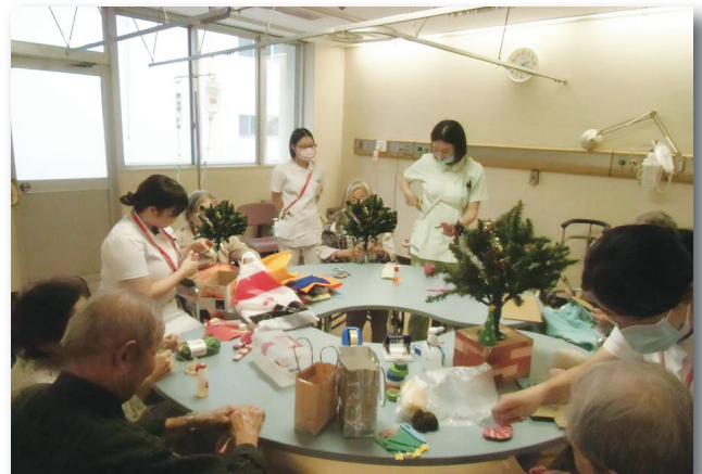
レクリエーションの様子（現在は見合わせています）

次に嚥下評価・嚥下訓練ですが、入院期間は10日間程度でその間に検査と訓練を行います。食事をしている時に、飲み込みづらい、むせてしまうなどがある方が対象です。摂食嚥下の認定看護師とともに、その方に合わせた食事のしかたや嚥下訓練を行っています。退院後も安全に食事ができるよう、食事内容、介助方法や嚥下訓練について、ご家族にもパンフレット等で説明を行います。