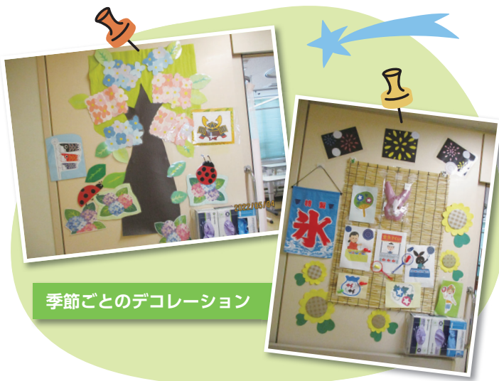
季節ごとのデコレーション

今回は、当院で行っているレスパイト入院と嚥下評価・嚥下訓練についてご紹介したいと思います。