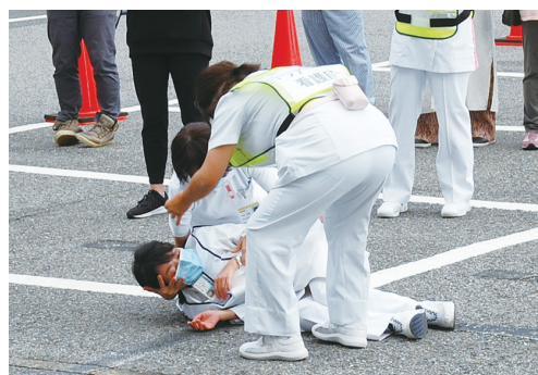
迫真の演技！ 動画でお伝え出来ないのが残念です。