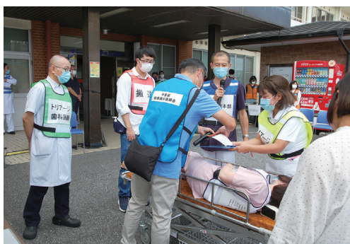
船橋市医師会、船橋歯科医師会の先生方にもご参加いただきました。

事前に予定していた予行演習が雨天中止となったため、ぶっつけ本番的な訓練となってしまいましたが、当日は天候にも恵まれ、特に患者役職員のシナリオを超越した迫真の演技のお陰もあり、緊張した中にも和やかな雰囲気、有意義な訓練ができたものと思っております。今回の反省点を踏まえ、次の機会には、二次トリアージの流れも含めてより充実したものにしたいと考えております。